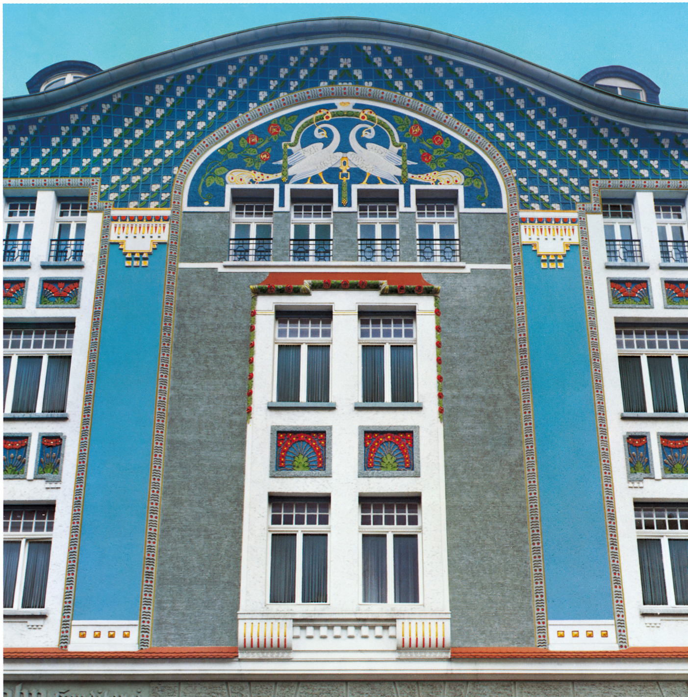
O fațadă fără egal stil Art-Nouveau. Renovat cu Alpinacolor de firma de zugrăvi Zimmermann, Darmstadt.